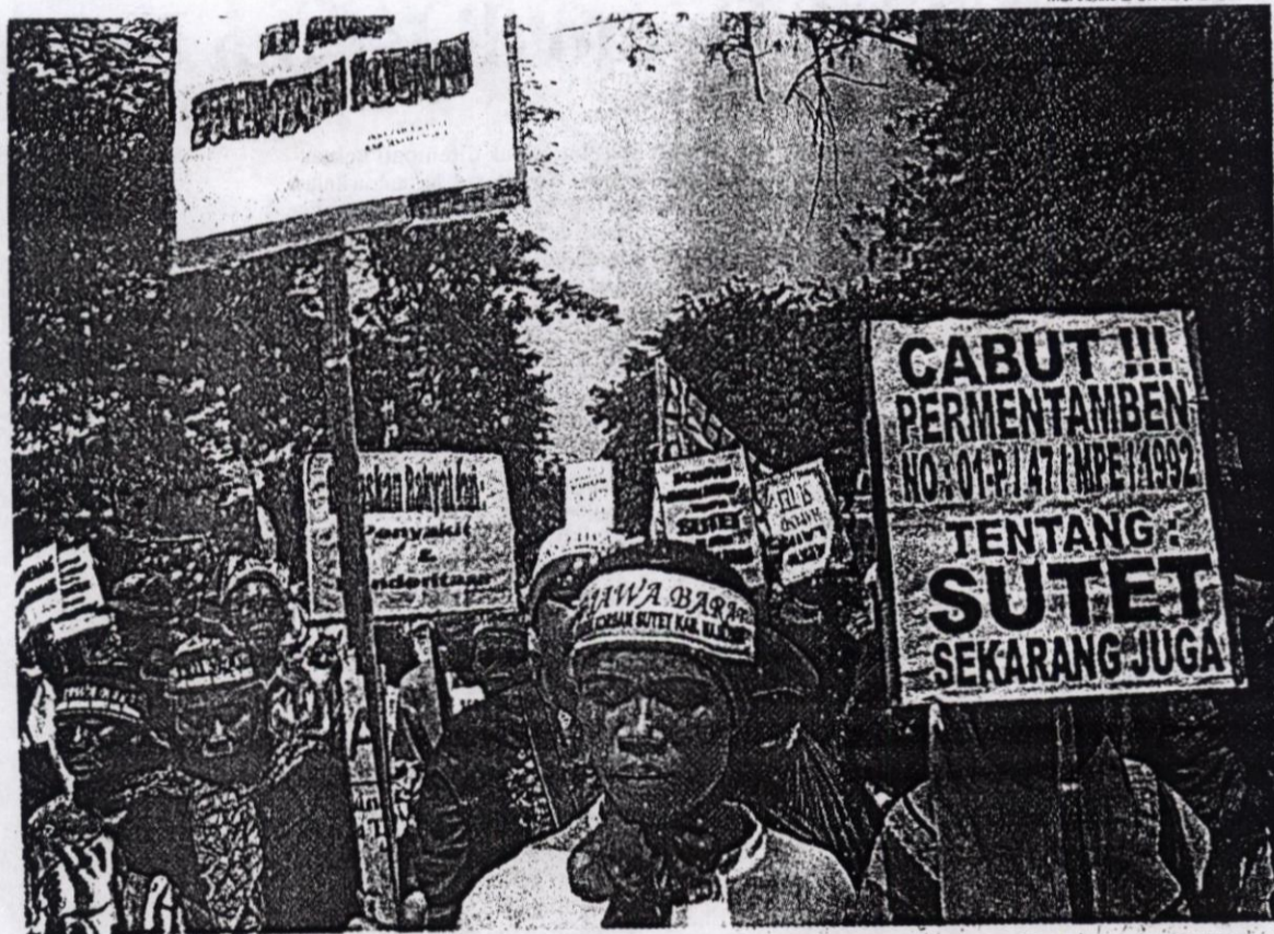
KORBAN SUTET: Ribuan pengunjung rasa dari keluarga Korban Saluran Udara Tegangan Ekstra Tinggi (SUTET) se Jawa Barat mendatangi Istana Negara Jakarta, Selasa (7/9). Dalam aksinya, mereka menilai akibat SUTET banyak masyarakat yang mengalami gangguan pernapasan.