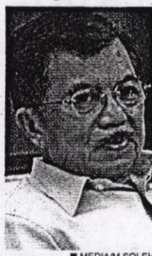
■ MEDIAAM SOLEH Jusuf Kalla