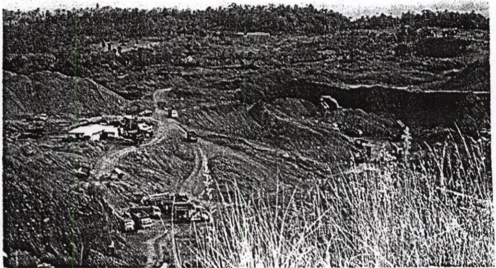
LINGKUNGAN RUSAK: Penggalan pasir berlangsung di sekitar Gunung Tampomas, Kabupaten Sumedang, beberapa waktu lalu. Perusakan lingkungan akibat penambangan pasir tidak hanya dilakukan para penambang liar, tetapi juga penambang legal.

Dari setiap titik, penambangan pasir dilakukan di areal yang luasnya mencapai 40 hektare (ha) hingga 80 ha. Sobirin menambahkan, data di