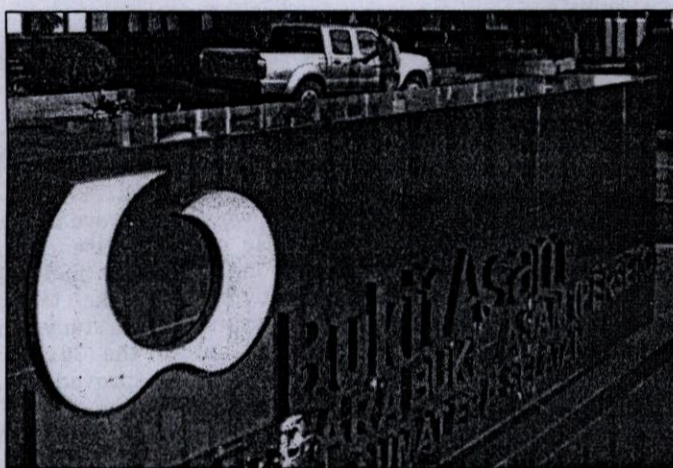
ENERGI ALTERNATIF - Permintaan komoditas batu bara sebagai energi alternatif diperkirakan meningkat, sehingga berpotensi menopang kinerja PT Tambang Batubara Bukit Asam Tbk (PTBA). Hal itu akan memicu saham Bukit Asam berpeluang mencapai level tertinggi Rp 4.000 yang pernah disentuh pada Mei tahun ini.

"Memang, saat ini pemerintah juga menyiapkan sumber energi lain, yakni biofuel . Namun, untuk itu kan perlu waktu dan investasi. Sedangkan batu bara sifatnya