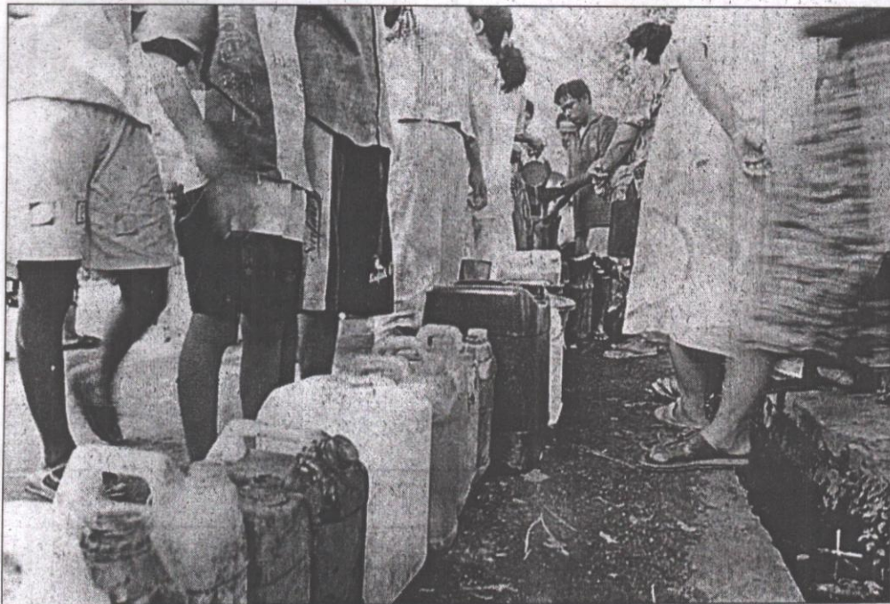
ADA PERMAINAN. Jatah minyak tanah untuk rumah tangga kerap diselundupkan.

lan terakhir. Menurut pensiunan jenderal ini, kelangkaan tersebut terjadi karena banyak minyak tanah untuk konsumsi rumah tangga yang dialihkan ke industri.