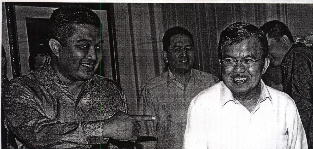
BERTEMU HIPMI: Wapres Jusuf Kalla berbincang dengan Ketua Umum Himpunan Pengusaha Muda Indonesia (Hipmi) Erwin Aksa (kiri) se usai bertemu di Jakarta, kemarin. Kalla meminta Hipmi mampu menjadi pendorong tumbuh dan berkembangnya segala aspek yang menjadi penggerak roda perekonomian.