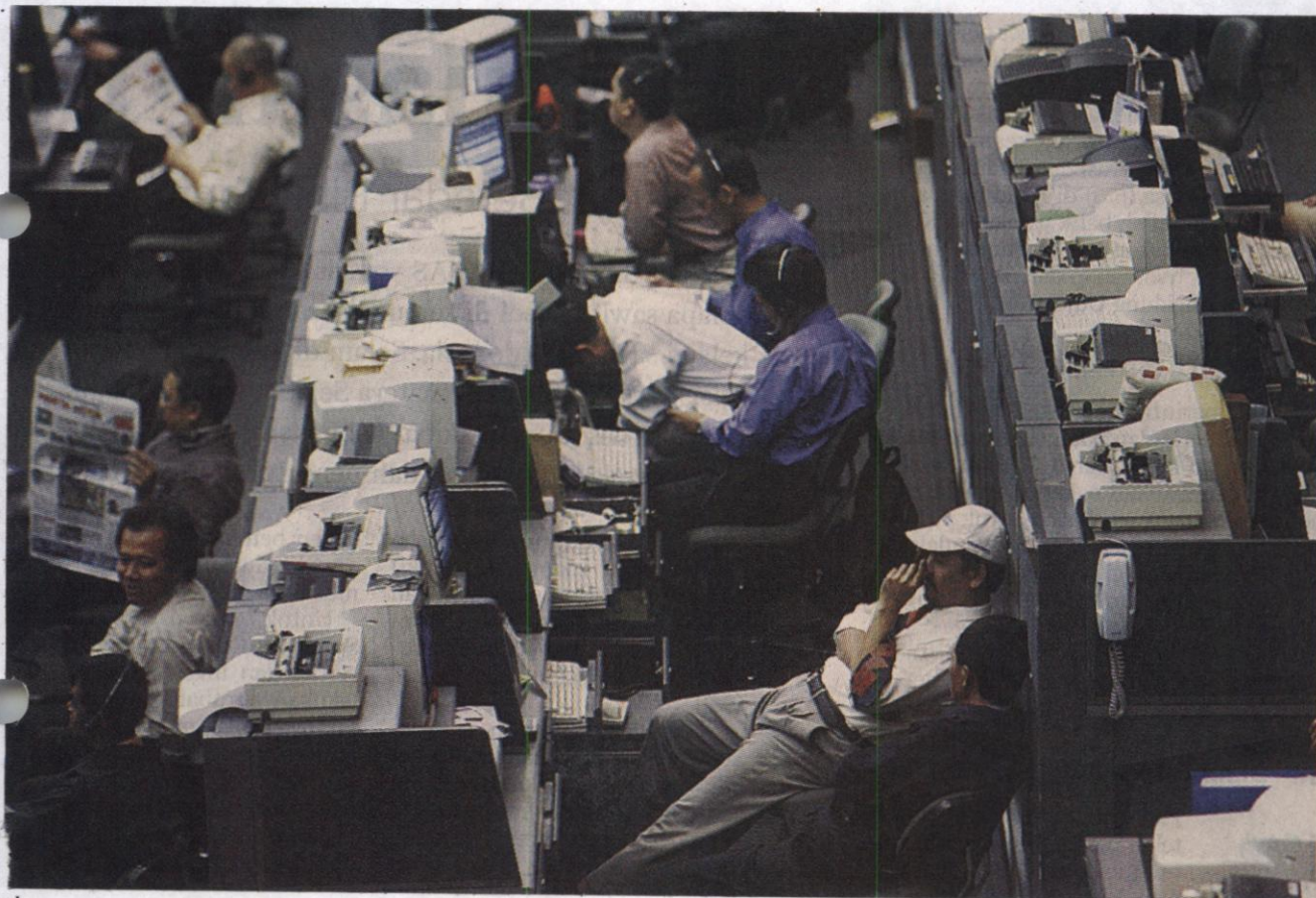
Pialang menjalankan aktivitas perdagangan saham di Bursa Efek Indonesia saat sistem telah berjalan normal kembali pada sesi perdagangan pertama, Selasa (5/8). Pembukaan sesi pertama perdagangan sempat terhambat sekitar 1 jam 15 menit akibat putusnya jaringan internal.