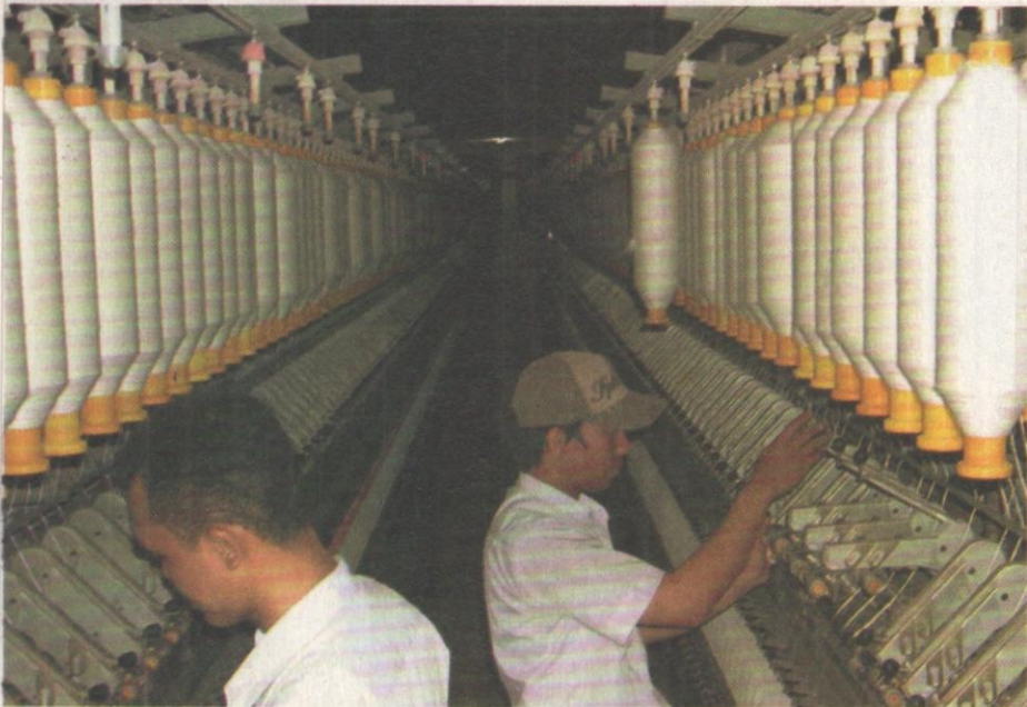
Karyawan PT Danliris Sukoharjo merawat mesin pemintal saat listrik pabrik dipadamkan.

Memang ada masalah-masalah teknis. Pergeseran Sabtu-Minggu itu akan menggeser kebiasaan pekerja bertemu dengan keluarga. Bagi kaum Nasrani yang beribadah Sabtu atau Minggu bagaimana? Apakah diberi