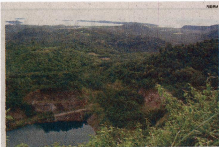
HIJAU: Keadaan tambang Messel dengan latar belakang Teluk Buyat

dian, tampak sebuah pos pengamatan kecil yang dipagari kayu sederhana. Di sebelah pos itu ada papan kecil yang bertuliskan: Dilarang Mengembalikan Sapi Di Sini.